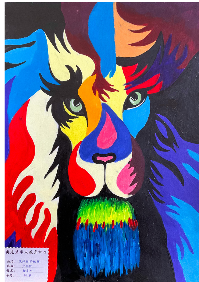
奥克兰华人教育中心