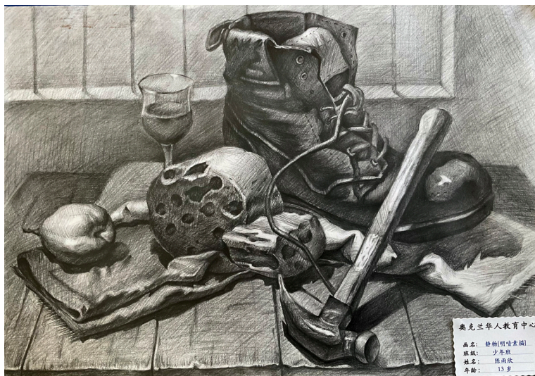
奥克兰华人教育中心 画名：静物(吃水果) 班级：少年班 姓名：陈雨欣 年龄：13岁