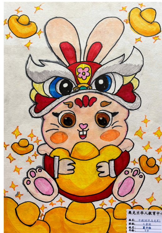
奥克兰华人教育中心 画名：卡通[彩色]兔 题材：儿童画 姓名：王子耀 年龄：8岁