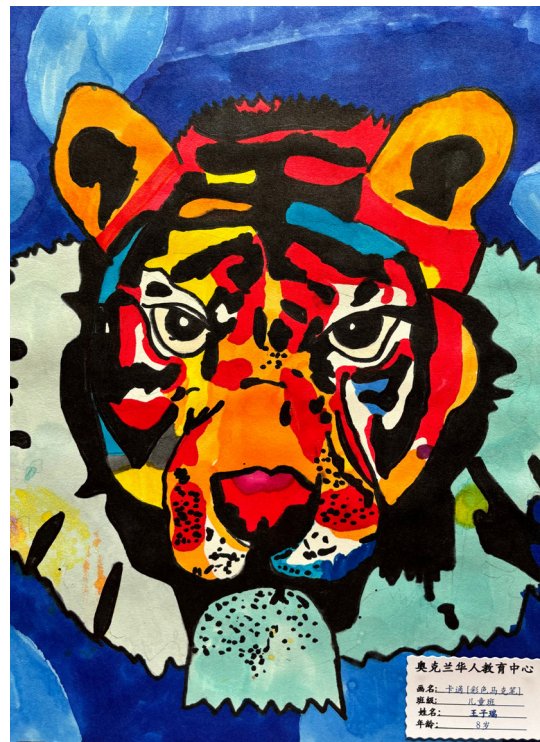
奥克兰华人教育中心 画名：卡通[彩色]虎 题材：儿童画 姓名：王子耀 年龄：8岁