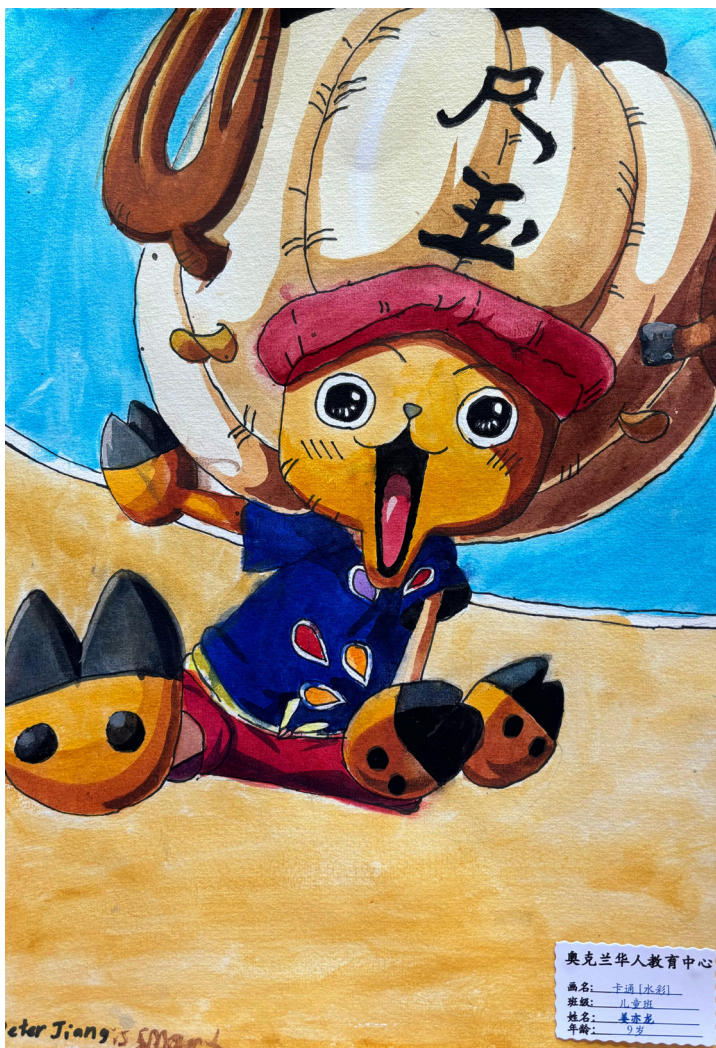
奥克兰华人教育中心 画名：卡通水彩画 班级：儿童班 姓名：姜宏毅 年龄：9岁